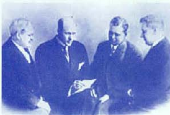
Първите четирима ротарианци

В спора се родила идеята да се създаде мъжки клуб, в който да членуват по един представител на всеки бизнес и професия. Било