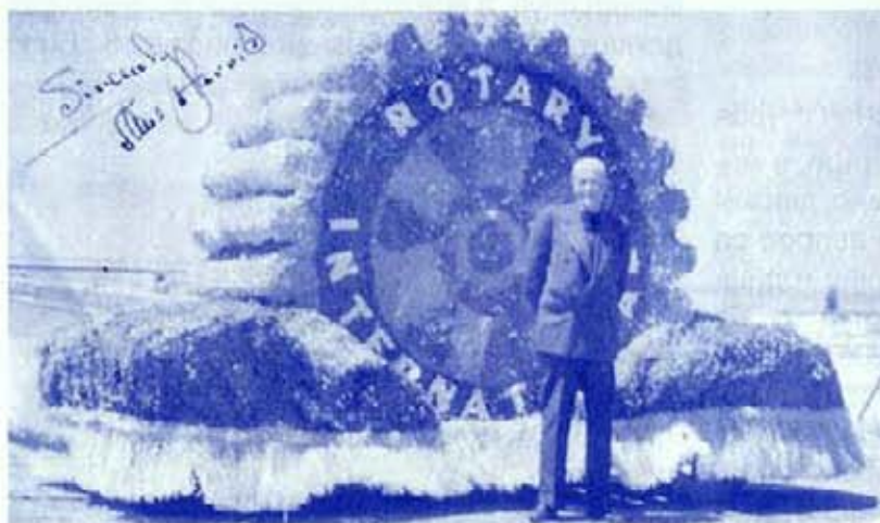
Снимка с автограф на Пол Харис от парада на Ротари в гр. Манисти, щат Мичиган, 1940 г.

Първият опит на Пол Харис да учреди клуб извън границите на