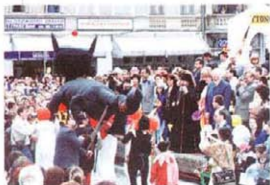
На карнавал като на карнавал...