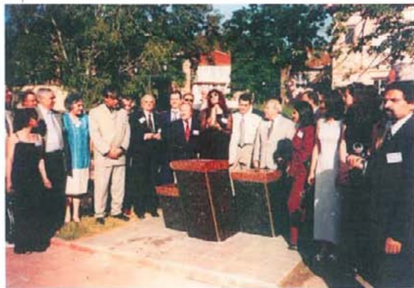
Откриване на чешмата в градинката на пл. „Свобода“