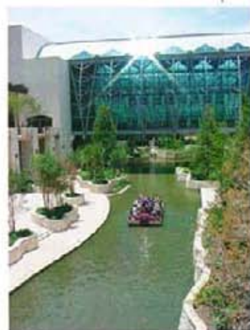
Конгресният център „Хенри Гонзалес“ в Сан Антонио